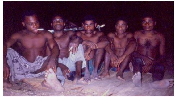
コンゴ共和国のピグミーの人びと